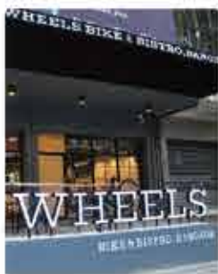
Bangkok THE WHEELS ★ 4.2