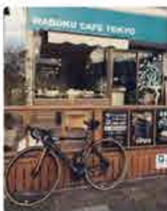
Tokyo WABOKU CAFE ★ 4.4