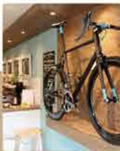
London Great British Cycling Cafe ★ 4.1