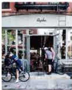
New York Rapha New York ★ 4.0